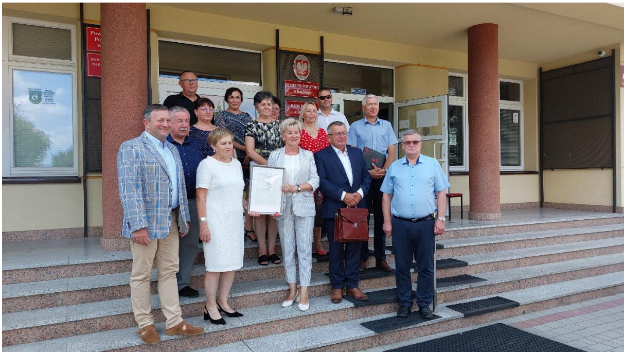
fot. PUP Tarnobrzeg

Powiatowy Urząd Pracy w Tarnobrzegu jako Lider projektu przygotował umowy o partnerstwie na rzecz projektu „Punkt w punkt” realizowanego na podstawie umowy zawartej z Ministerstwem Rodziny i Polityki Społecznej w ramach projektu „Czas dla Młodych - punkty doradztwa dla młodzieży” w latach 2023-2024 w trybie projektu pilotażowego. Nasi partnerzy to: Urząd Miasta i Gminy Nowa Dęba, Urząd Miasta i Gminy Baranów Sandomierski, Urząd Gminy Grębów, Urząd Gminy Gorzyce, Miejsko-Gminny Ośrodek Pomocy Społecznej w Nowej Dębie, Miejsko-Gminny Ośrodek Pomocy Społecznej w Baranowie Sandomierskim, Gminny Ośrodek Pomocy Społecznej w Grębowie, Ośrodek Pomocy Społecznej w Gorzycach. Uroczyste podpisanie umów o partnerstwie odbyło się 23.08.2023 roku.